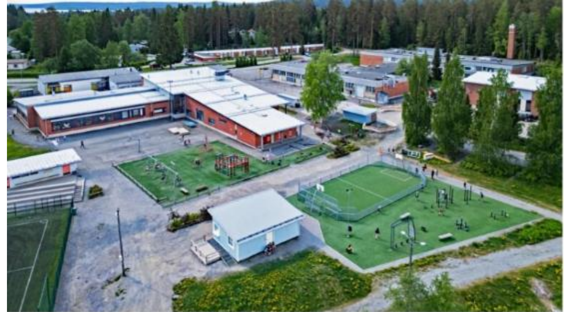
Laajennusosa sijoittuu Rovastinkankaan koulun taakse, kuvassa taka-alalla näkyvän purettavan ammattikoulurakennuksen paikalle.