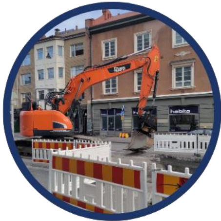
KATU- JA MAARAKENTAMINEN

Palvelemme kolmessa eri teemassa – näissä saavutamme merkittävimmät taloudelliset ja ympäristölliset hyödyt.